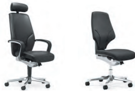
giroflex 68 Siège pivotant